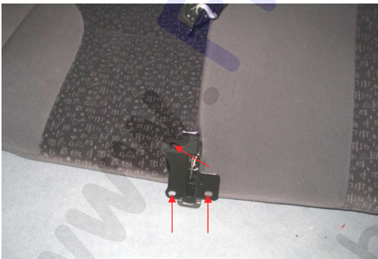
Bild zeigt das Verbindungsscharnier zwischen den beiden Sitzrückenteilen, die Pfeile zeigen die 3 Befestigungspunkte (hinten 2x T40 und vorne 1x T50 mit den Gurtschlössern zusammen).